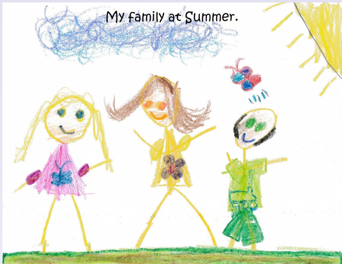
មើលលោក អាយុ 6 ឆ្នាំ សម្លេងនៃការប្រកួតប្រជែងរបស់កុមារ ឆ្នាំ 2016។

ទូរស័ព្ទ ៖ 1-888-201-1014 - ប្រសិនបើអ្នកមានអាយុក្រោម 60 ឆ្នាំ និងមានប្រាក់ចំណូលទាប។ រិទ្ធិសន្តិសុខ ខេត្តវ៉ាស៊ីនតោន 206-464-1519។ ប្រសិនបើអ្នកមានអាយុលើស 60 ឆ្នាំ ដែលមានប្រាក់ចំណូលនៅកម្រិតណា មួយ សូមហៅទូរស័ព្ទទៅកាន់លេខ 1-888-387-7111។