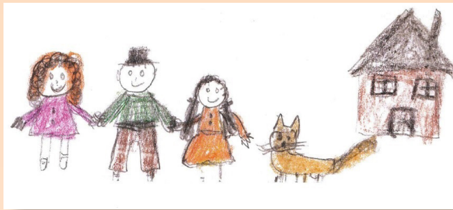
អាមេរិក អាយុ 5 ឆ្នាំ សម្លេងនៃការប្រកួតប្រជែងរបស់កុមារ ឆ្នាំ 2004