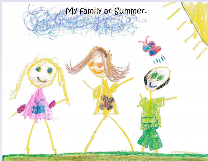
Melena 6 Tuổi. Voices of Children Contest 2016.